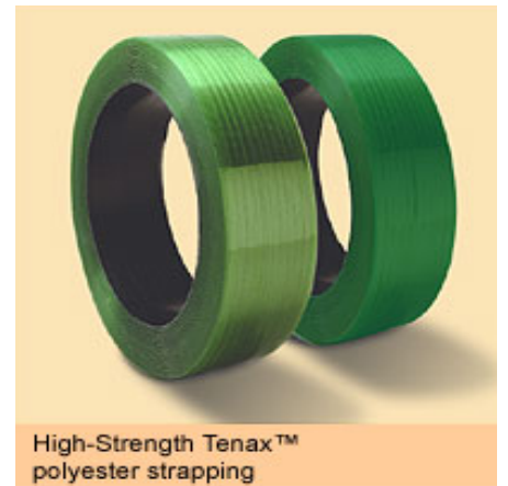
High-Strength Tenax™ polyester strapping

Tenax Strapping が進化したスチールストラッピングを超えた高強度ストラップです。