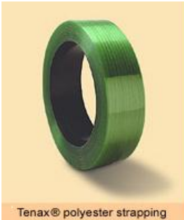
Tenax® polyester strapping