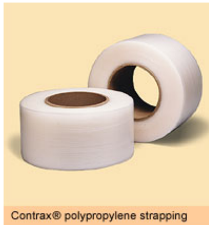
Contrax® polypropylene strapping